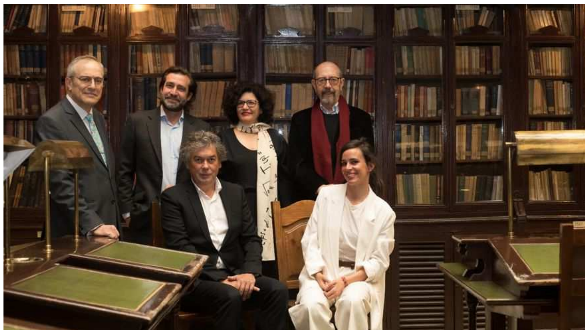
Candidatura Grupo 1820 a las elecciones a Junta Directiva del Ateneo de Madrid.